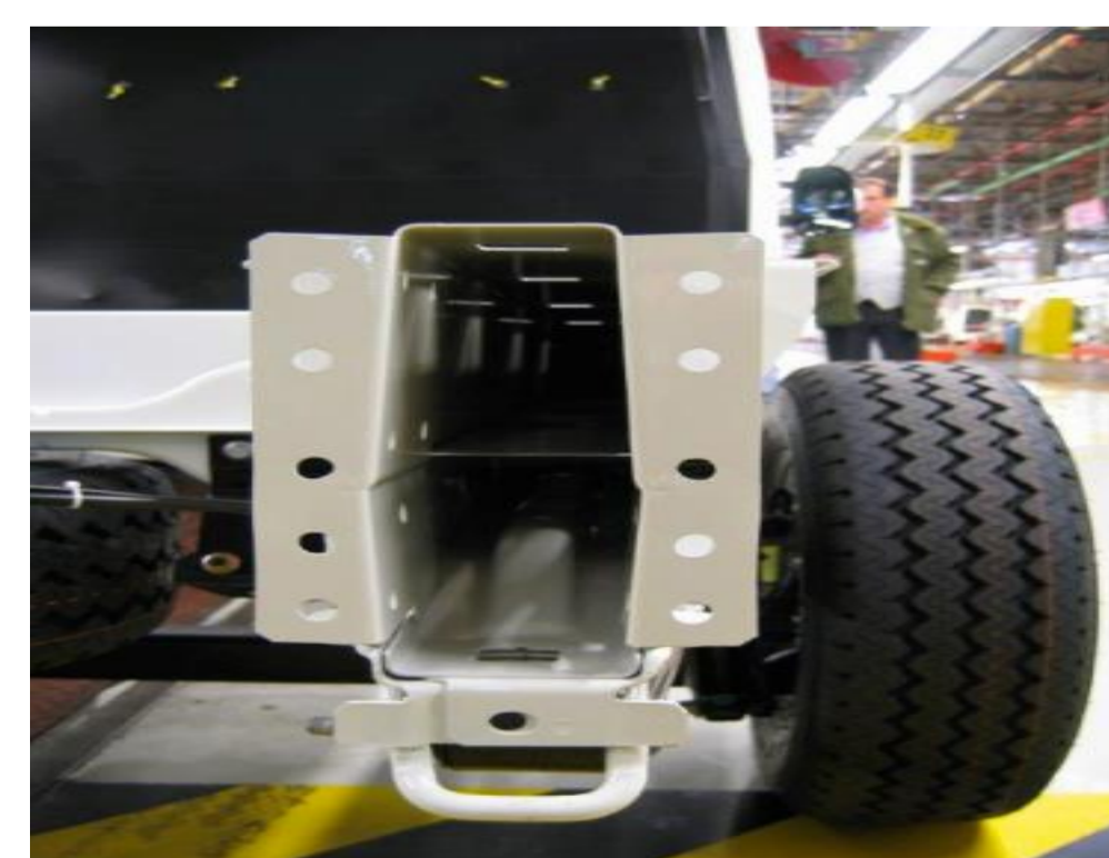
Подвійна рамна рейка "U"-типу.