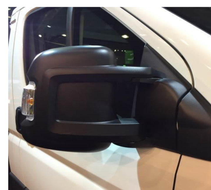
↑ стандартні зовнішні дзеркала.